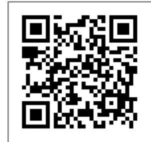
スマートフォン用QRコードを読み取り グーグルフォームからお申し込みください

PCから申込みアドレス https://forms.gle/vxqZug1gbVbka1eq9